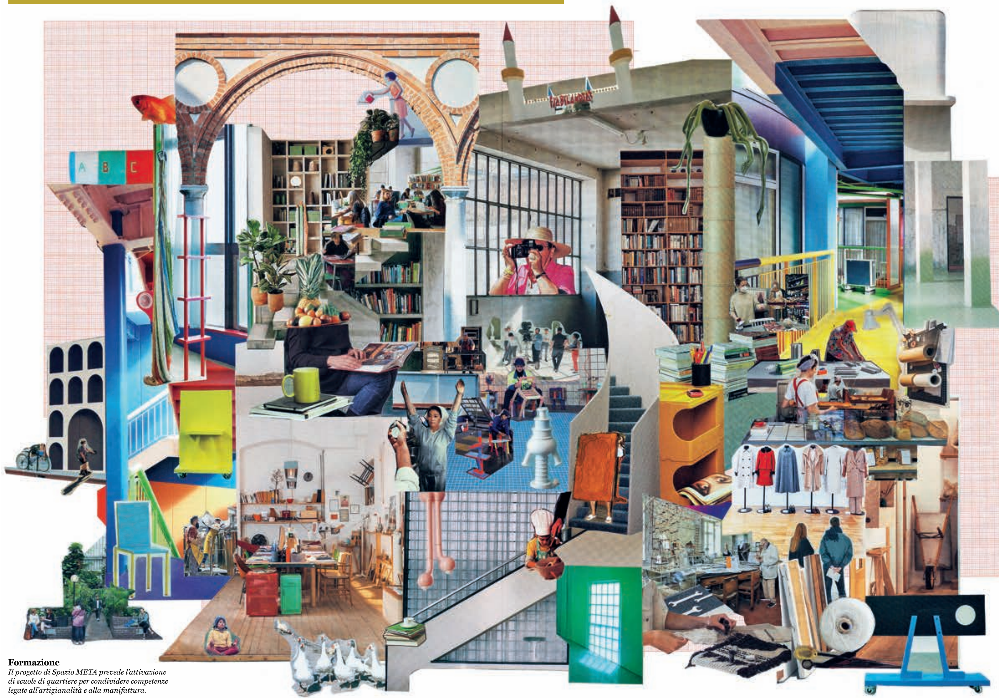
Formazione Il progetto di Spazio META prevede l'attivazione di scuole di quartiere per condividere competenze legate all'artigianalità e alla manifattura.